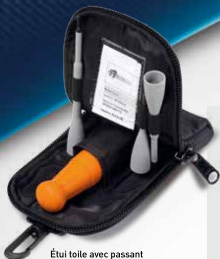
Étui toile avec passant ceinture et mousqueton d'accroche